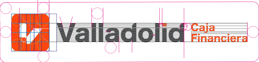
Logotipo versión vertical